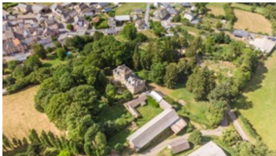
Figure 1 : parcelle du domaine de Montfranc

Situé sur les hauteurs du village d'Arvieu, le domaine de Montfranc est une bâtisse de la fin du XVIII e siècle (1787). A la fois autonome et connecté au village, ce bien offre un large potentiel en terme d'hébergements et d'accueil grâce à sa surface de 500 m 2 habitables et à son terrain arboré d'1,4 hectare.