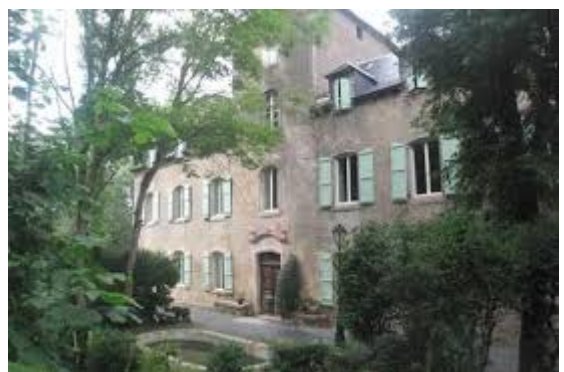
Figure 3 : Entrée principale, façade sud

L'aménagement extérieur et intérieur du domaine de Montfranc offre un certain cachet à préserver et à mettre en valeur : on retrouve devant l'entrée un petit bassin, un puits, un balcon terrasse, un espace jardin sous tonnelle, des cheminées en marbres, des moulures, une grande hauteur sous-plafond, etc... Autant de signes qui montrent le caractère bourgeois du bien.