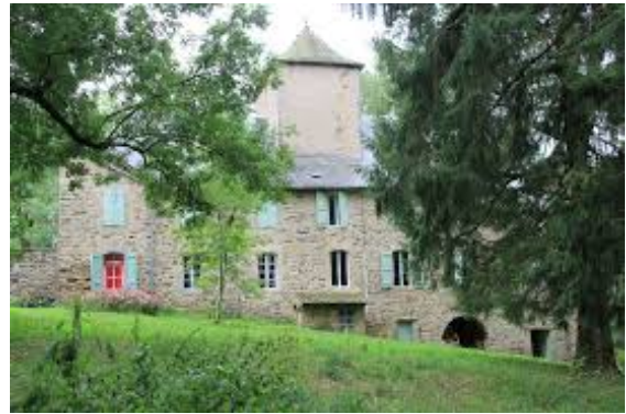
Figure 2 : façade nord

Composé d'un château, d'une dépendance et d'un atelier-garage, le domaine, bien qu'il nécessite des travaux comme l'isolation des combles et de la tour, le remplacement du système de chauffage et l'entretien du terrain, n'en demeure pas moins habitable en l'état. Des travaux ont par ailleurs déjà été mis en oeuvre : réfection des toitures, remplacement des anciens vitrages par du double vitrage bois.